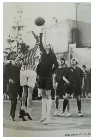
Main gauche derrière le dos

Main gauche derrière le dos, sous l'oeil sévère d'un arbitre en costume de ville, nos arrière-grands-mères à l'entre-deux.