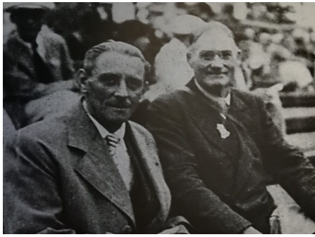
A Berlin au cours des JO, Marcel BARILLE (à gauche) à côté de James NAISMITH l'inventeur du Basket

Le Basket s'implante partout en France, les compétitions régionales sont en plein essor avec 215 équipes. Sur les terrains, la grogne s'amplifie contre les "musiciens du sifflet à une note" à qui sont reprochés des manquements fréquents à l'application convenable des règles. Cela entraîne le 1er rassemblement national des arbitres pour harmoniser l'interprétation des règles (déjà !!).